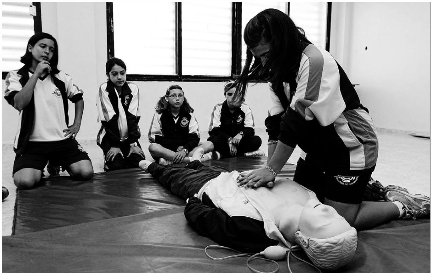
Los alumnos de Primaria del centro aprenden a realizar un masaje cardíaco durante la clase de Educación Física. ARCINIEGA

Esta iniciativa se enmarca dentro de las actividades que realiza la Ampa para la promoción de hábitos saludables. Así, el pasado jueves día 23 de abril durante la clase de Educación Física, cerca de 120 alumnos de 6º de Primaria conocieron de primera mano qué hacer en caso de presenciar cómo alguien se atraganta o un infarto: la fórmula 'ver, oír y escuchar', la posición de seguridad que debe te-