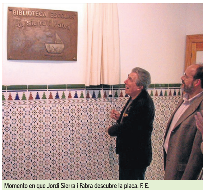
Momento en que Jordi Sierra i Fabra descubre la placa. F. E.

En su palmarés aparece más de una treintena de premios, tanto por obras en español como en catalán -Nacional de Literatura Infantil y Juvenil, Vaixell de Vapor, Gran Angular, Edebé, Columna Jove, Joaquim Ruyra, CCEI, A la orilla del viento, entre otros muchos-. Además, como prueba de una reconocida humanidad, hace escasas fechas ha puesto en marcha, como confirmaron las autoridades educativas del IES María Zambrano durante el acto