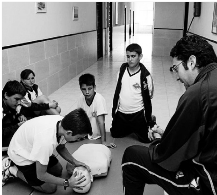
Cerca de 120 alumnos asistieron el primer día a los cursos. ARCINIEGA

ner la víctima, la colocación de las manos para realizar el masaje cardíaco o el boca-boca.